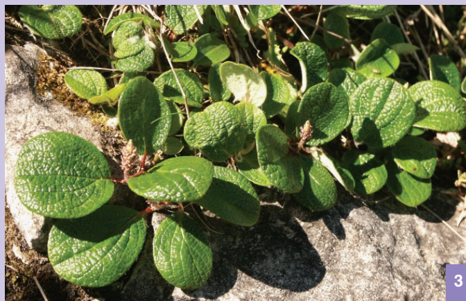
3. Wierzbą żyłkowana ( Salix reticulata )

Szczególną grupę roślin we florze tatrzańskiej stanowią tzw. relikty epoki lodowcowej. Wraz z ocieplaniem się klimatu w okresie holocenu i wkroczeniem lasów na obszar niżu europejskiego zasięgi tych roślin straciły ciągłość z ośrodkiem swojego powszechnego występowania tj. z tundrą okołobiegunową. Rośliny te zawdzięczają swoją obecność w Tatrach surowym warunkom piętra alpejskiego i sprzyjającym właściwościom podłoża. Do gatunków reliktowych należą m.in. dębik ośmiopłatkowy ( Dryas octopetala ) oraz wierzbą żyłkowana ( Salix reticulata ).