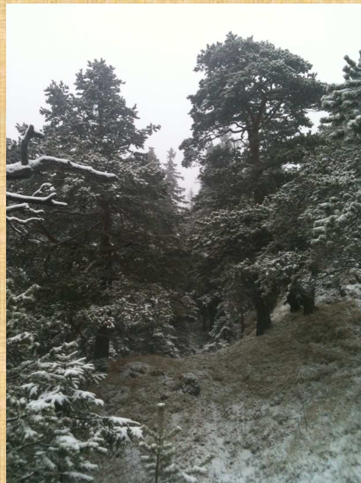
Reliktowe lasy sosnowe Vario-Pinetum w Wielkich Koryciskach