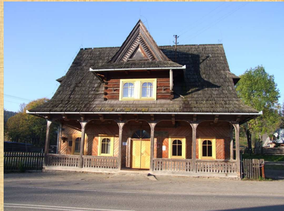
Siedziba Wspólnoty Leśnej 8 Uprawnionych Wsi w Witowie