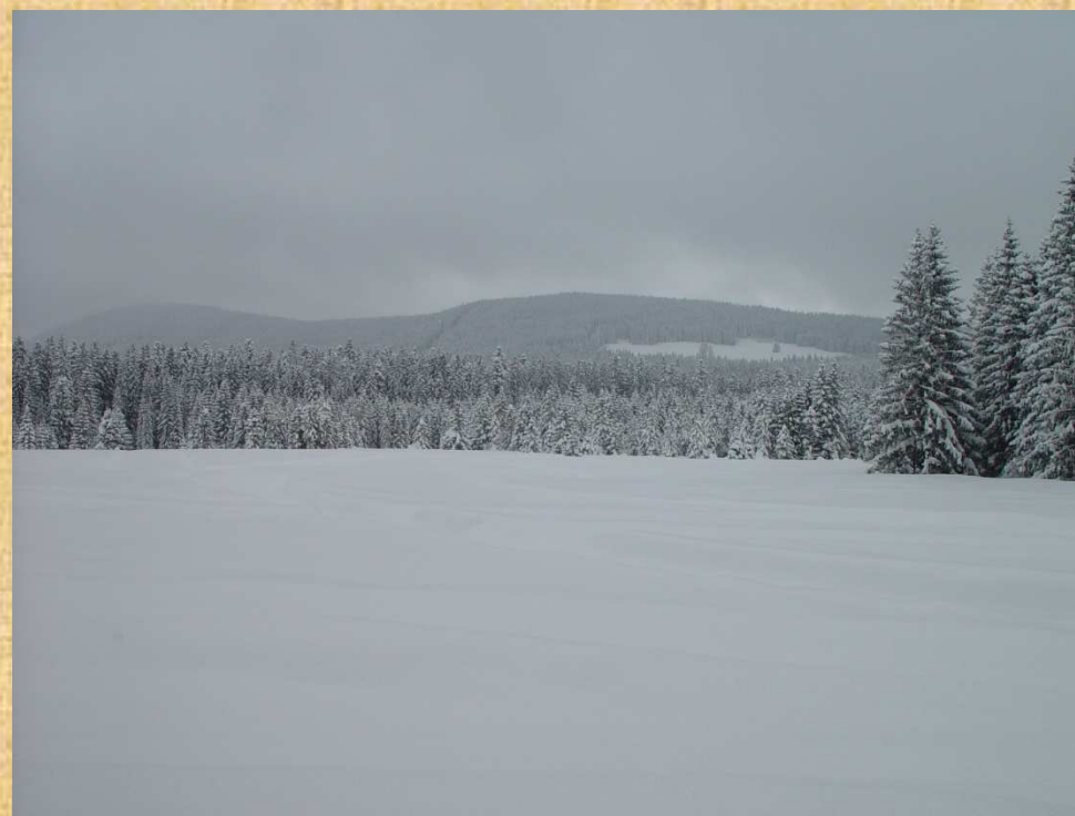
Widok z Polany Molkówki na lasy Wspólnoty Leśnej na Magurze Witowskiej