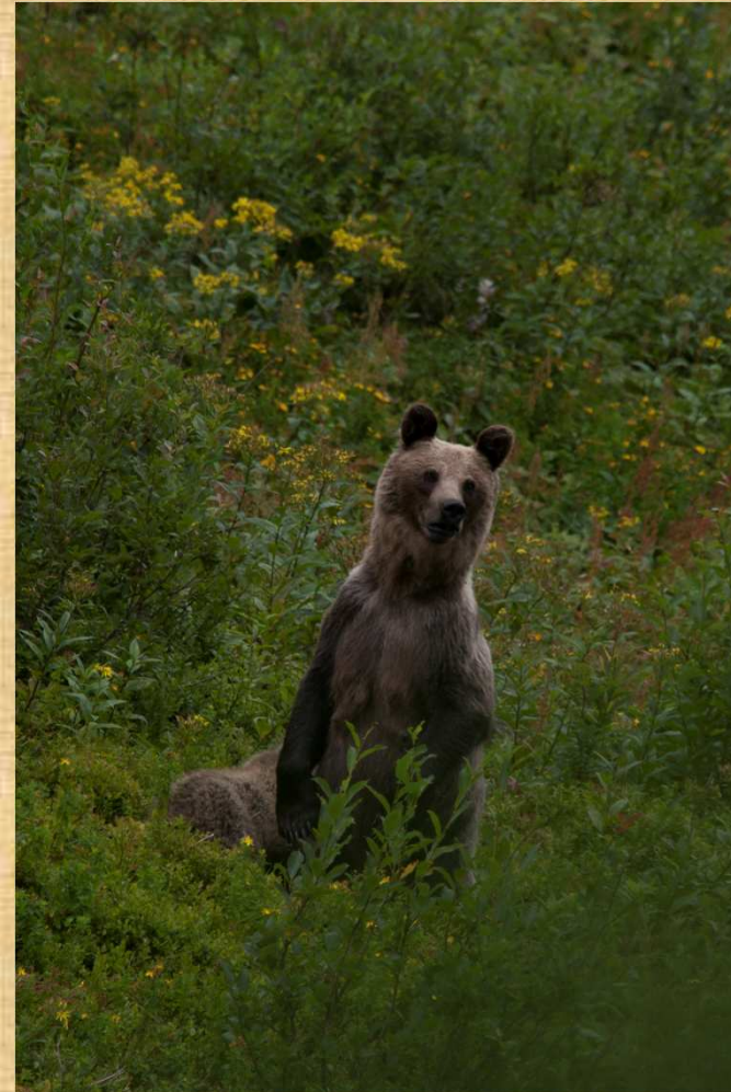
Dol. Chochołowska stanowi miejsce schronienia m. in. dla niedźwiedzia brunatnego ( Ursus arctos )