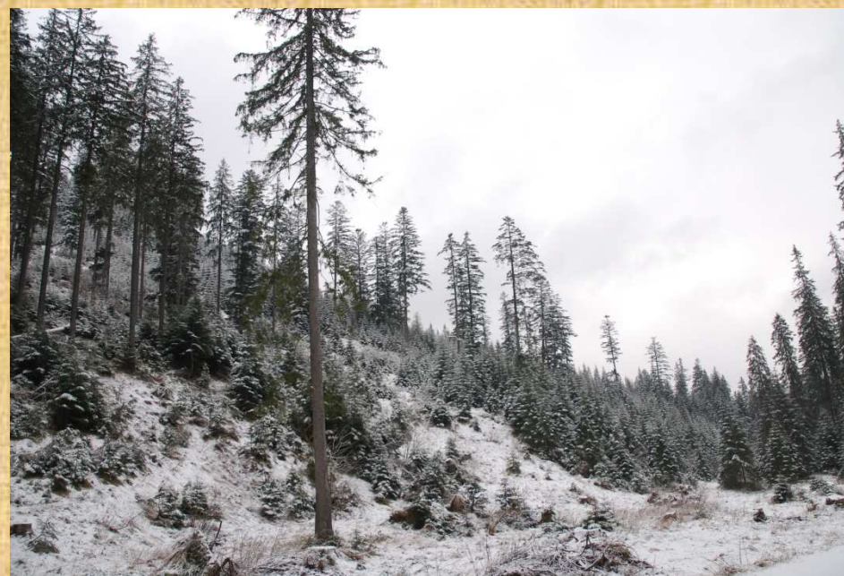
Naturalne odnowienie lasu w Dol. Chochotowskiej, w tle wiekowe jodły