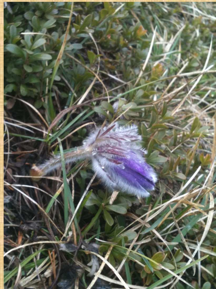
Sasanka słowacka ( Pulsatilla slavnica ) endemit zachodniokarpacki, występujący w Polsce tylko w Dol. Chochołowskiej