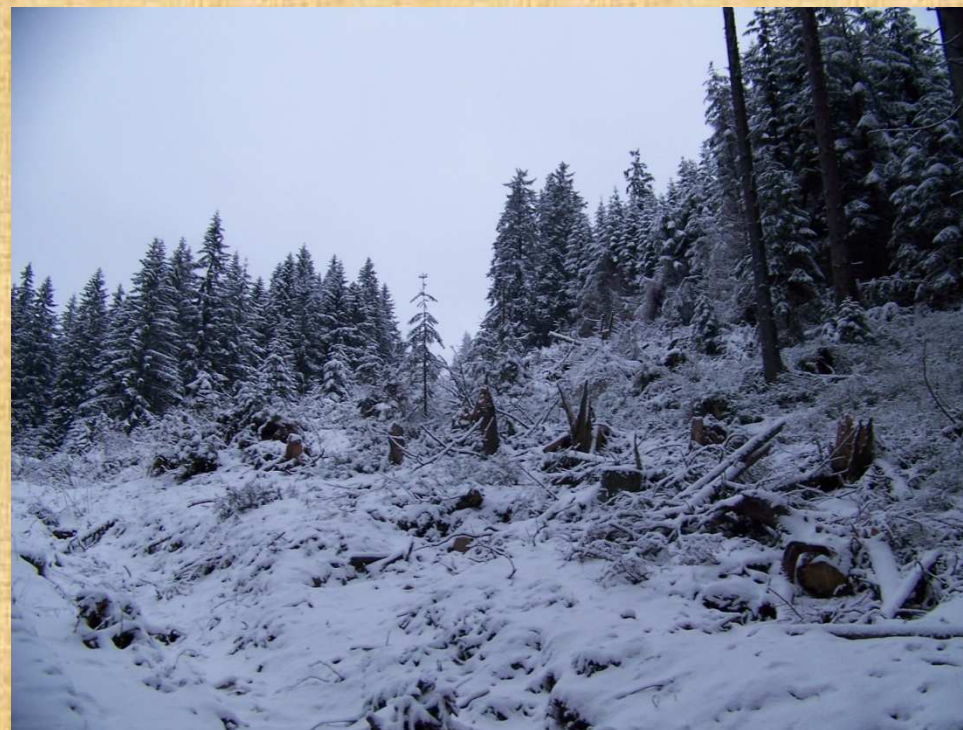
Tor lawiny spadającej z południowych zboczy Bobrowca do Bobrowieckiego Żlebu