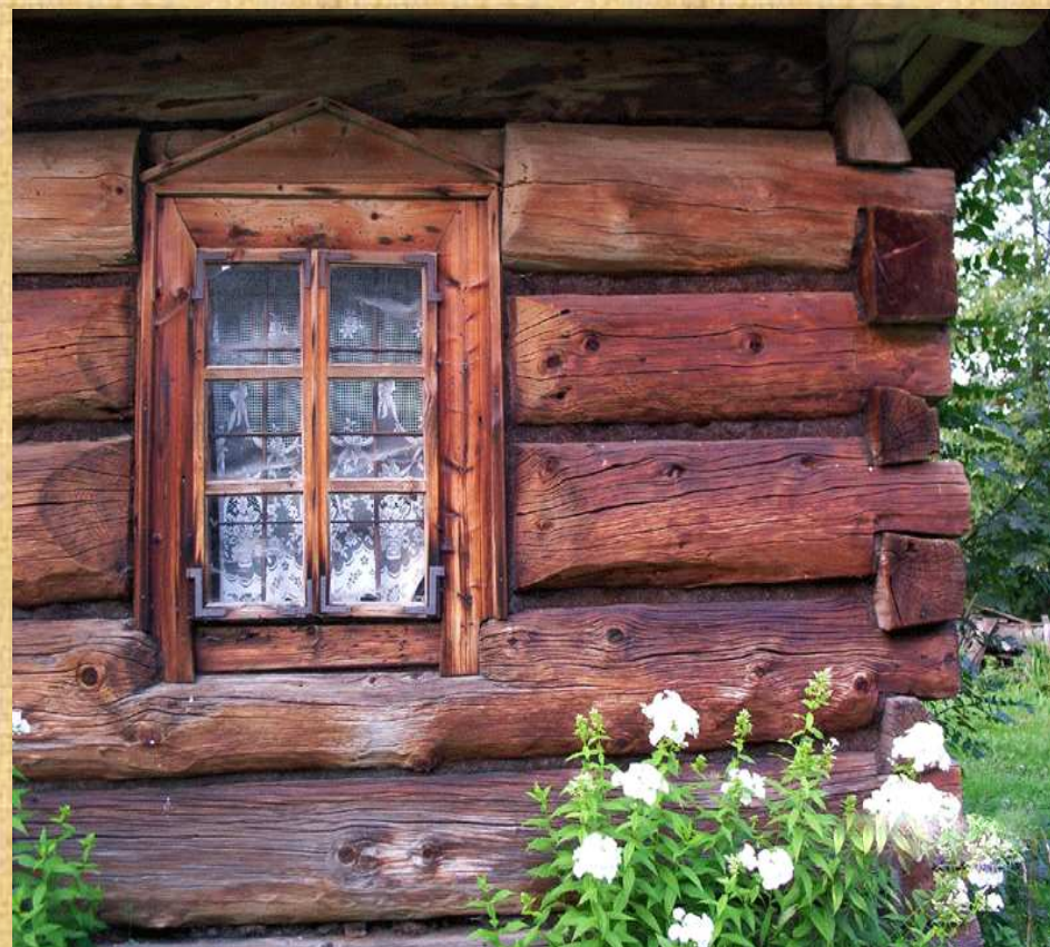
Zabytkowe drewniane chałupy w Chochołowie zbudowane zostały ze „smreków” i „jedli” z tatrzańskich lasów Wspólnoty Leśnej